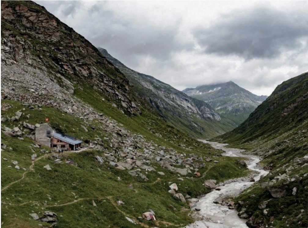
Länggletscher mit Länggletscherhütte SAC, Graubünden – Ausgangspunkt der künstlerischen Forschungswoche.